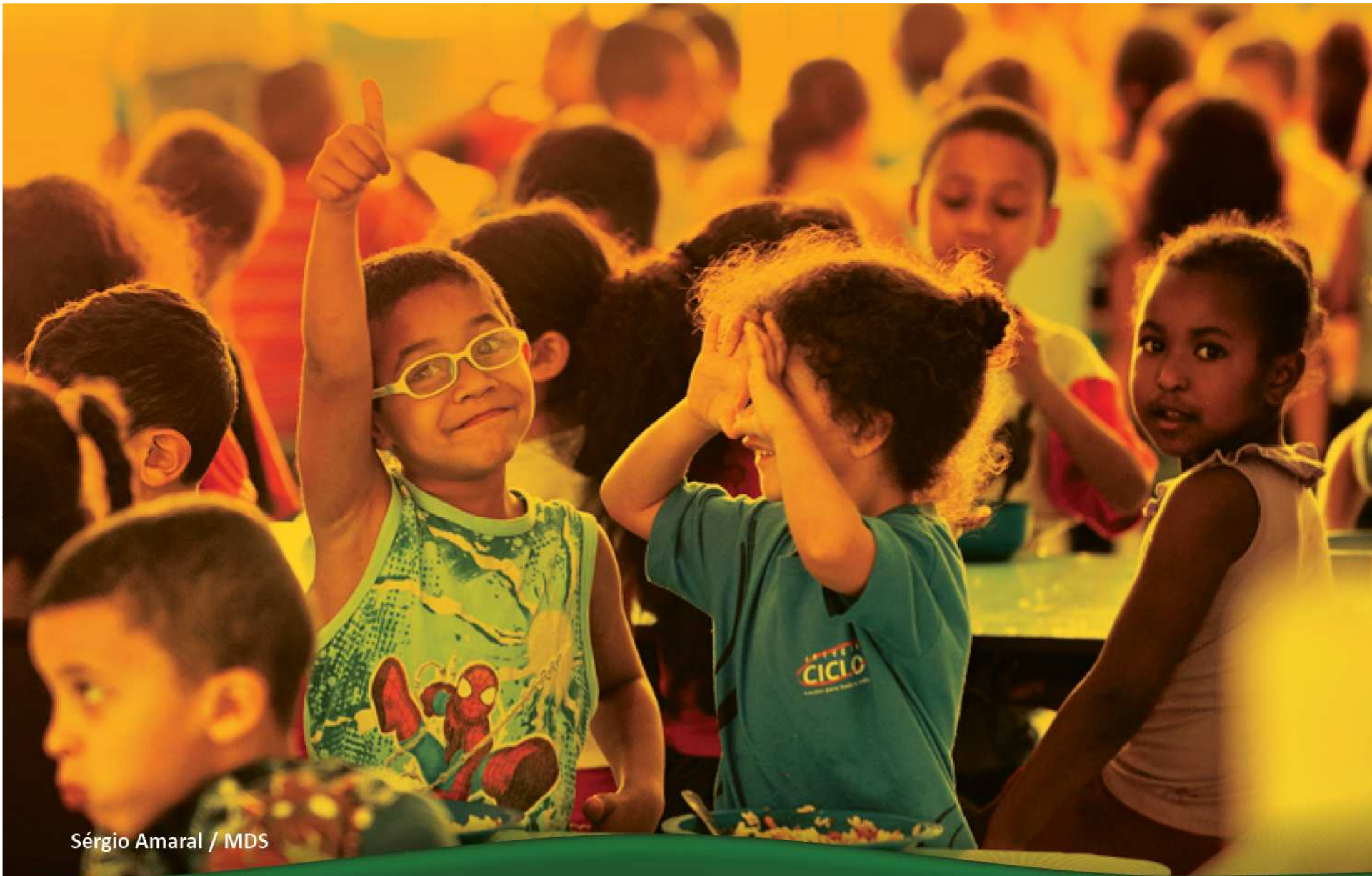
Sérgio Amaral / MDS